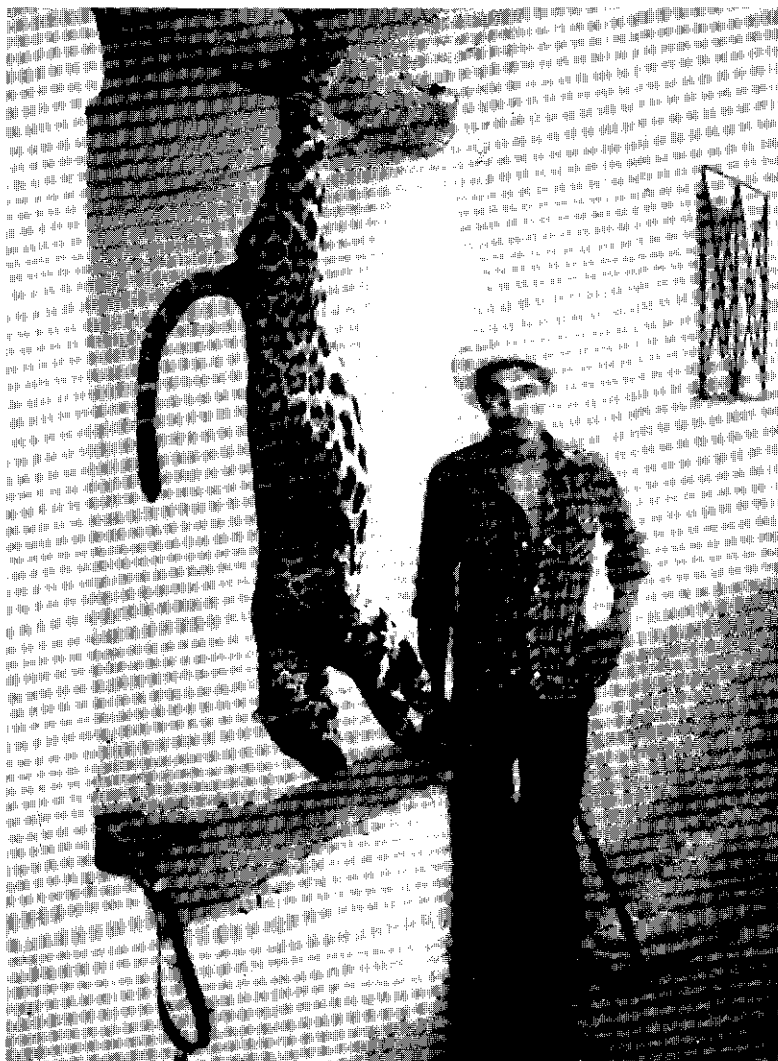
Figura 3 Jaguar hembra adulta cazada en el Ejido Benito Juárez, en la Sierra Madre de Chiapas.

decidieron resolver ellos mismos el problema. El animal cazado fue una hembra de avanzada edad, a juzgar por el desgaste de los dientes, con un peso de 37 kg y ambos caninos superiores rotos.