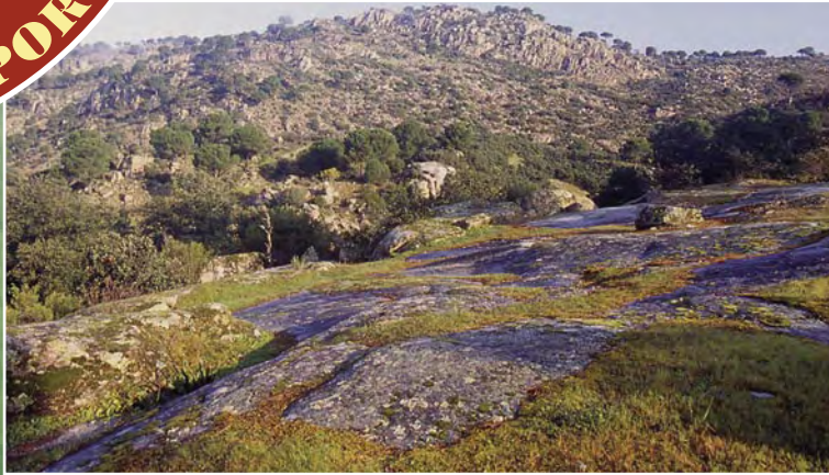
Es preferible trabajar en 300 has. de forma intensa y con un esfuerzo sostenido en el tiempo, que en 3.000 o 30.000 has. de forma difusa y con actuaciones espacialmente dispersas.

jo, durante cuanto tiempo permanecen en el medio estas poblaciones creadas mediante manejo, y lo que es fundamental: si debemos prolongar en el tiempo el manejo del hábitat y el mantenimiento de las actuaciones realizadas.